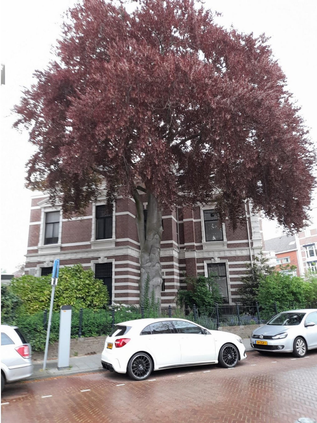
Productie 3 – habitus van de bruine beuk

Producties 3 en 4: foto's van de monumentale beuk Bankplein 3 te Den Haag (Bomenstichting Den Haag).