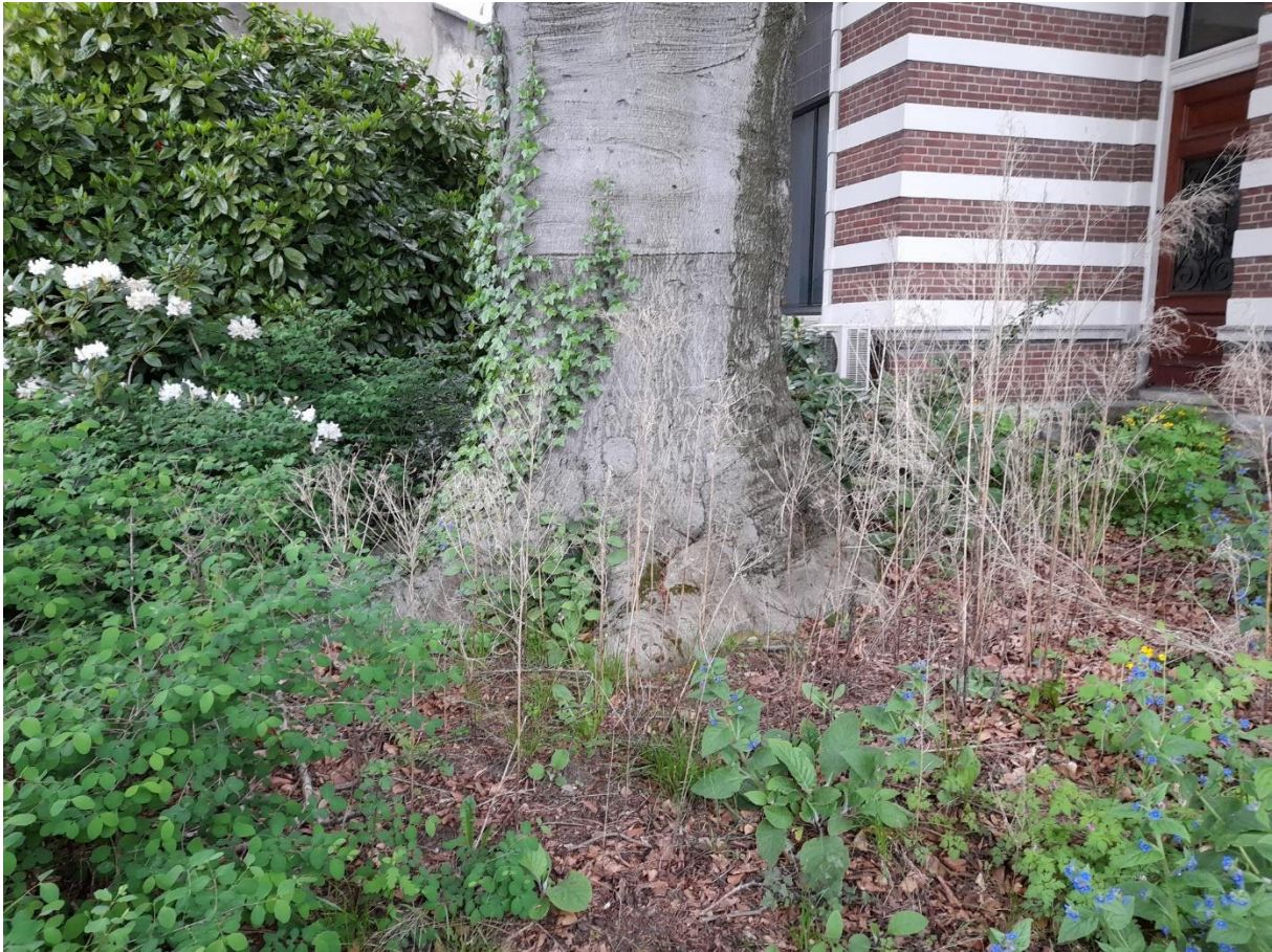
Productie 4 – stamvoet van de bruine beuk